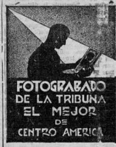
FOTOGRAFADO DE LA TRIBUNA EL MEJOR DE CENTRO AMERICA

ESTOCOLMO, 3. UP. — El agregado de prensa en el cuartel general noruego de Forrnoss ha confirmado telefónicamente que todas las fuerzas anglo-francesas se retiraron de la región de Namsos durante el miércoles y el jueves pero no ha suministrado detalles.